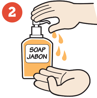
Use soap and make a lather