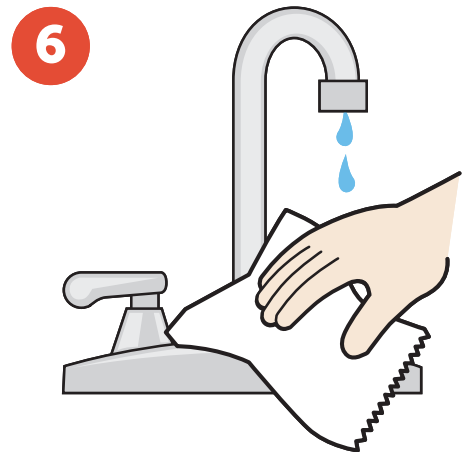
Use a paper towel to shut off the faucet