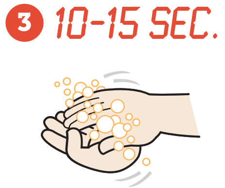
10-15 SEC. Rub and scrub thoroughly for 10 - 15 seconds. Scrub palms, back of hands, between fingers and under nails.