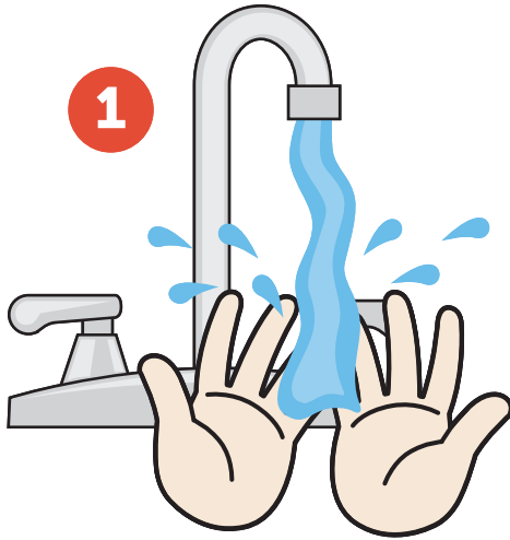
Start with warm or hot water