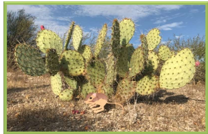
Calli chequeando un nopal en el Feliz Paseos Park

Comparte una foto de tu propia rata canguro y mira algunas de las aventuras de Calli en nuestra página de Facebook: